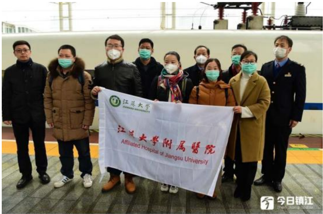
镇江医疗团队出发。