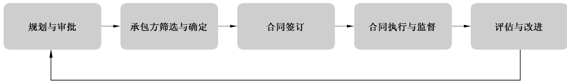
图2 发包工作过程示意图